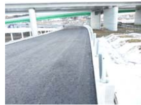
⑥ 谷地地区 P104付近