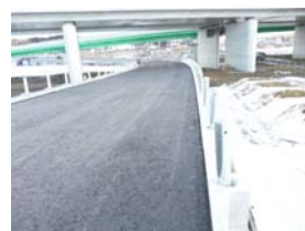
⑥ 谷地地区 P104付近