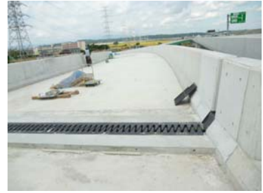
⑥ 谷地地区 P104付近