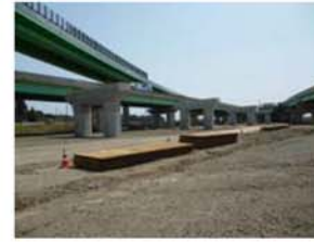
⑧砂押地区 P 1 2 5 付近

多賀前地区下部工工事 受注者：岩田地崎建設(株) 工期：H24.9.11~H25.7.19