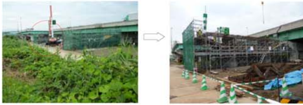
⑦市川地区 P 1 1 2 付近