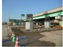
多賀城高架橋 (下り) L=3.7Km