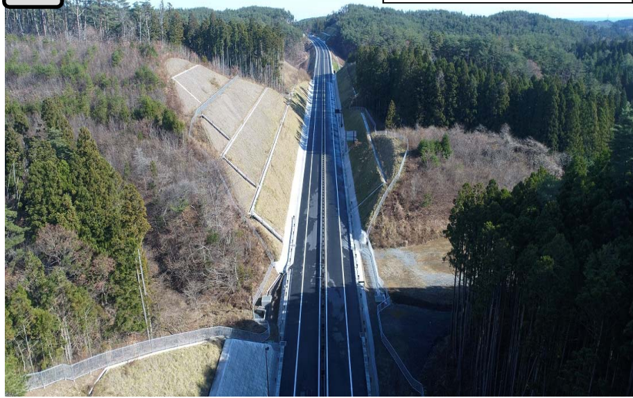
③ NO253から終点側を望む