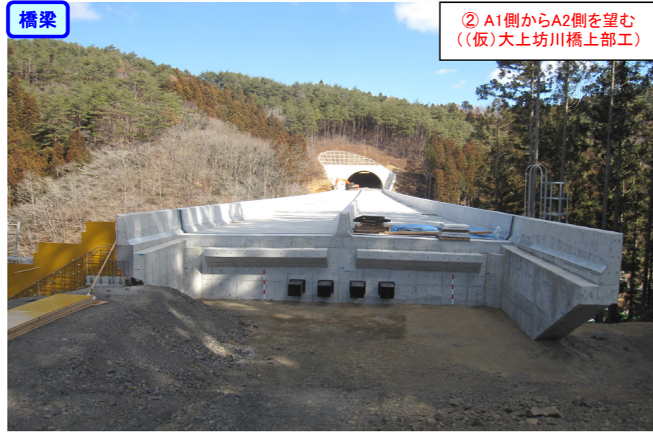
② A1側からA2側を望む ((仮)大上坊川橋上部工)

立沢北地区上部工工事 受注者：オリエンタル白石(株) 工期：H28. 6. 17～H29. 3. 21