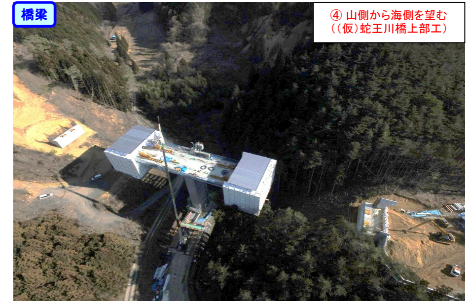
④ 山側から海側を望む ((仮)蛇王川橋上部工)