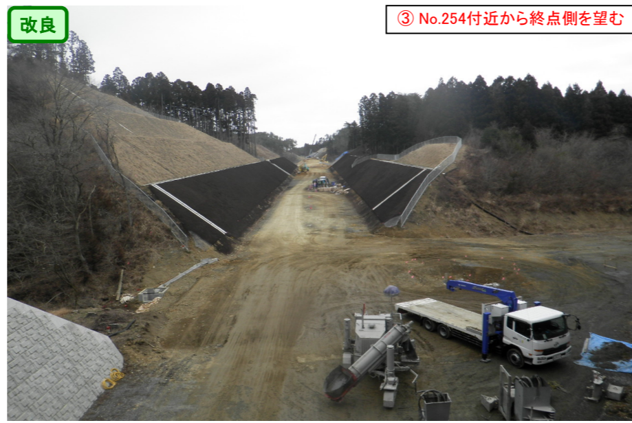
③ No.254付近から終点側を望む