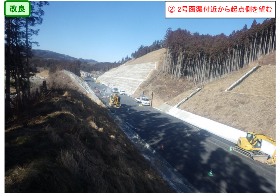
② 2号函渠付近から起点側を望む