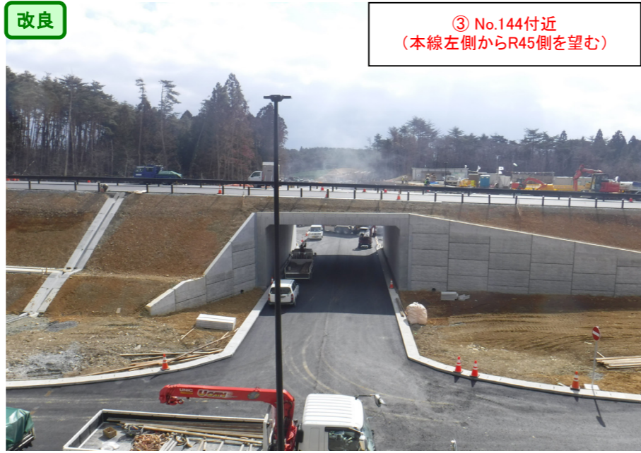
③ No.144付近 (本線左側からR45側を望む)