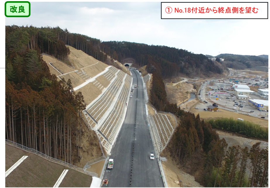
① No.18付近から終点側を望む