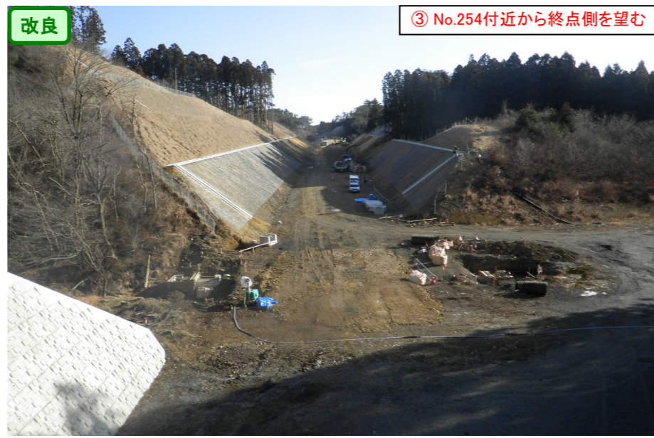
③ No.254付近から終点側を望む