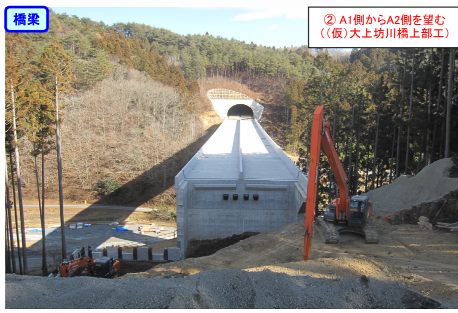
② A1側からA2側を望む ((仮)大上坊川橋上部工)

立沢北地区上部工工事 受注者：オリエンタル白石(株) 工期：H28. 6. 17～H29. 3. 21