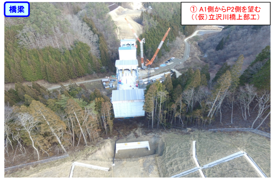
① A1側からP2側を望む ((仮)立沢川橋上部工)