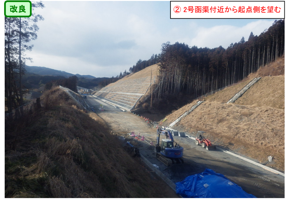
② 2号函渠付近から起点側を望む