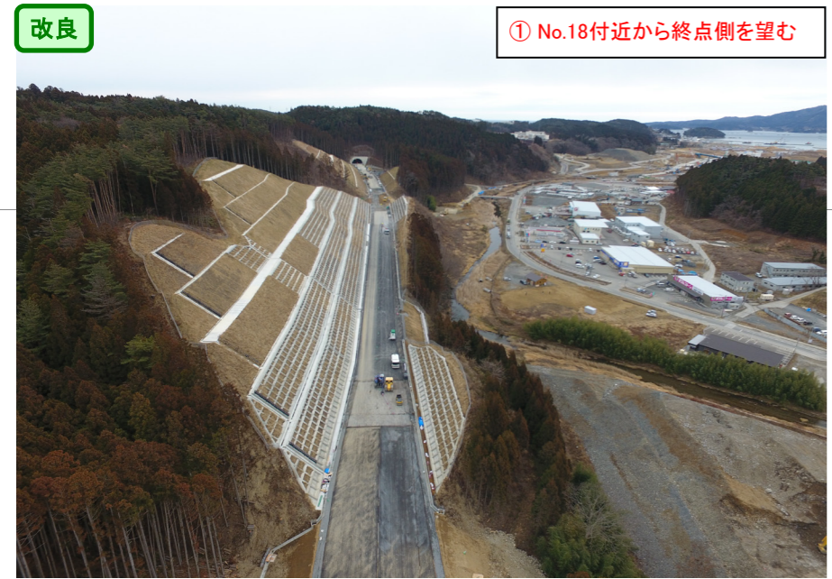
① No.18付近から終点側を望む