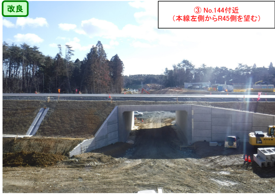
③ No.144付近 (本線左側からR45側を望む)