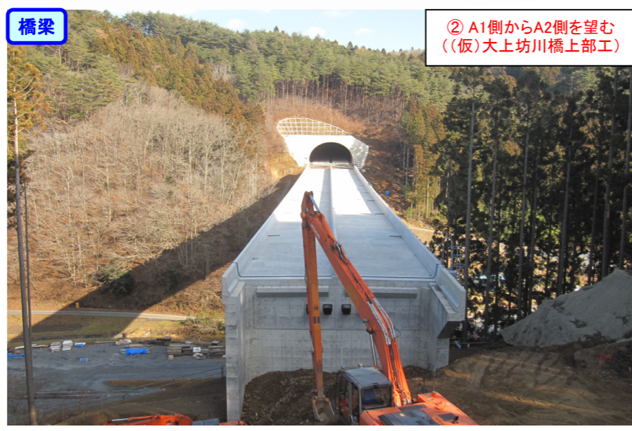
② A1側からA2側を望む ((仮)大上坊川橋上部工)

立沢北地区上部工工事 受注者：オリエンタル白石(株) 工期：H28. 6. 17～H29. 3. 21