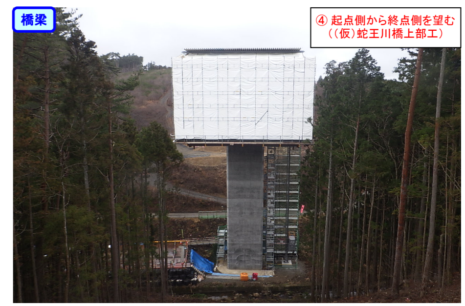
④ 起点側から終点側を望む ((仮)蛇王川橋上部工)