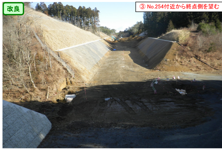
③ No.254付近から終点側を望む