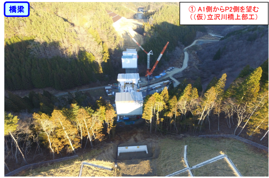
① A1側からP2側を望む ((仮)立沢川橋上部工)