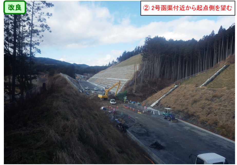
② 2号函渠付近から起点側を望む