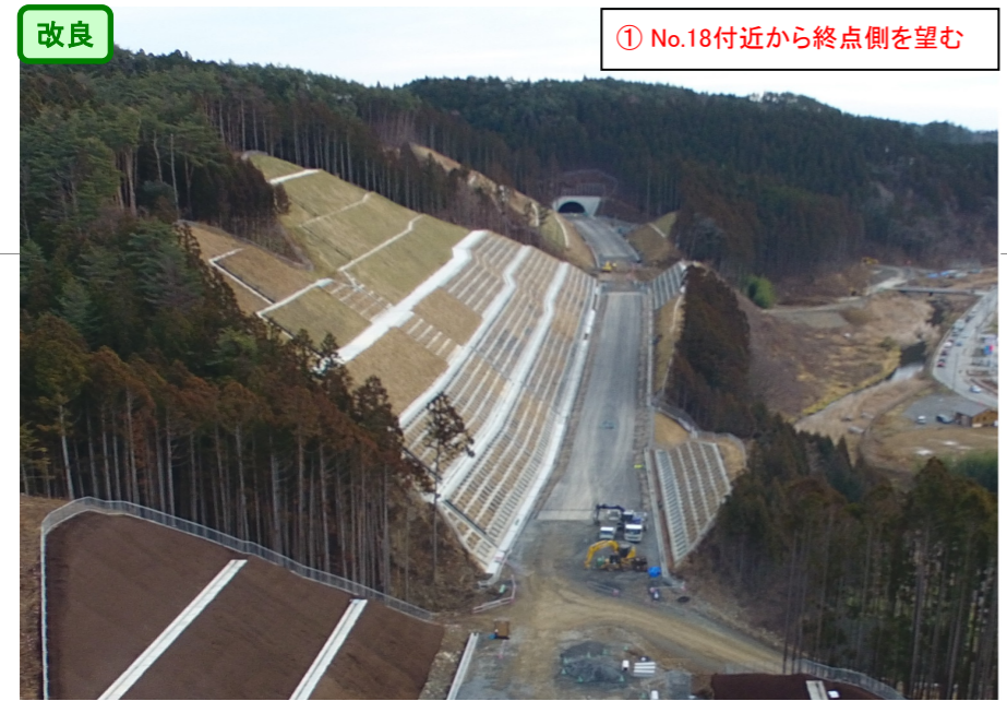
① No.18付近から終点側を望む