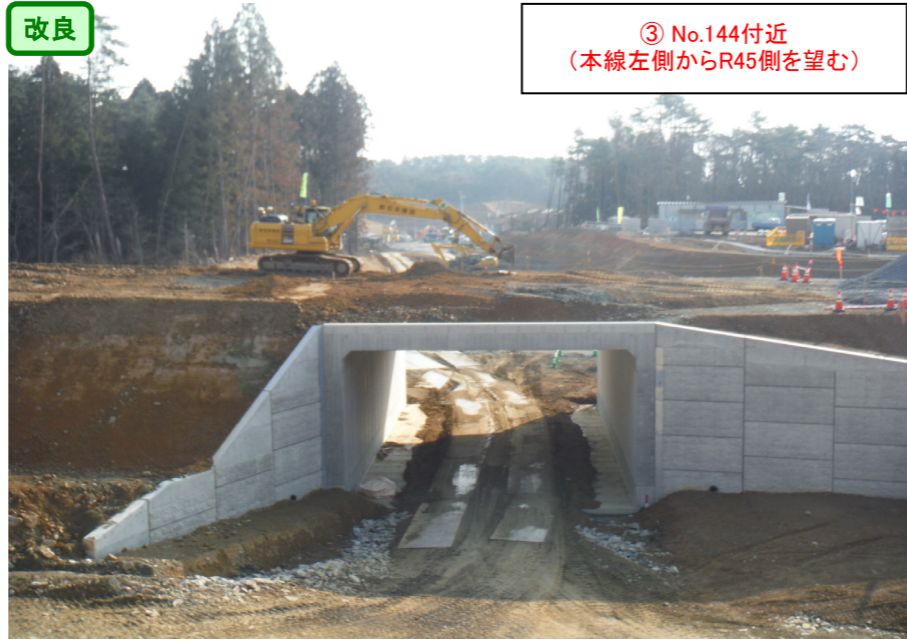
③ No.144付近 (本線左側からR45側を望む)