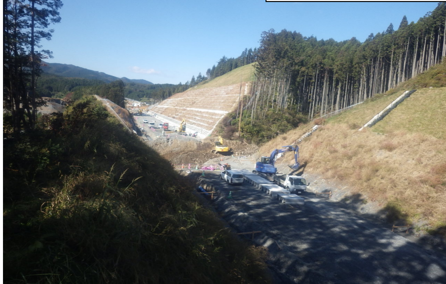
② 2号函渠付近から起点側を望む