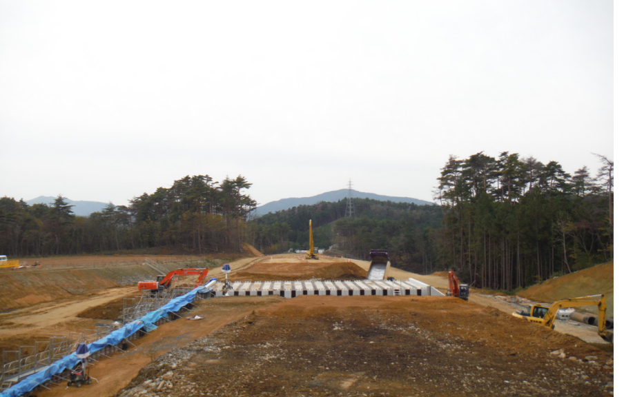
④ No.146付近から起点側を望む