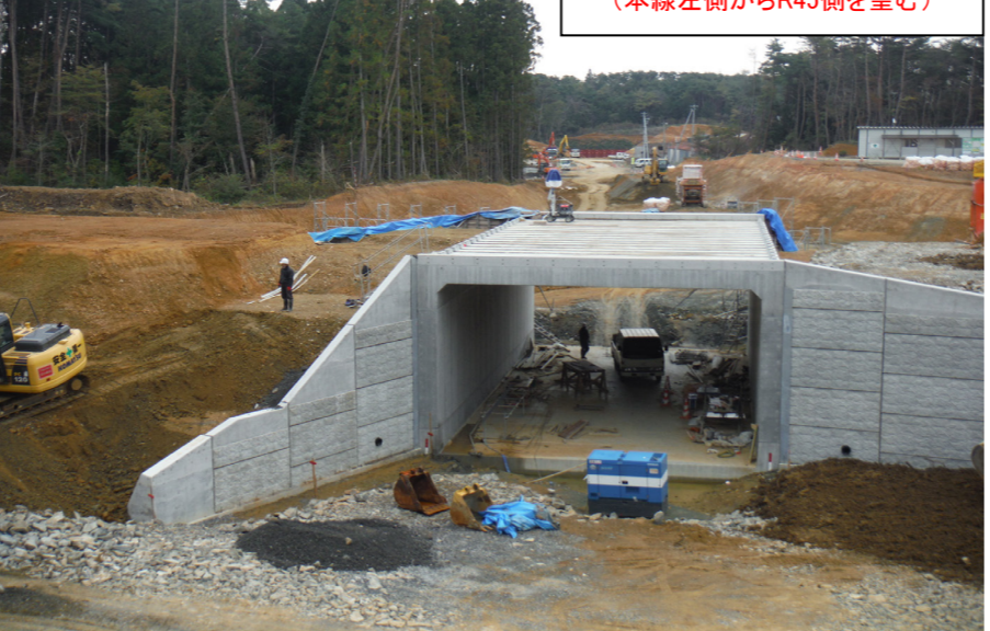
③ No.144付近 (本線左側からR45側を望む)