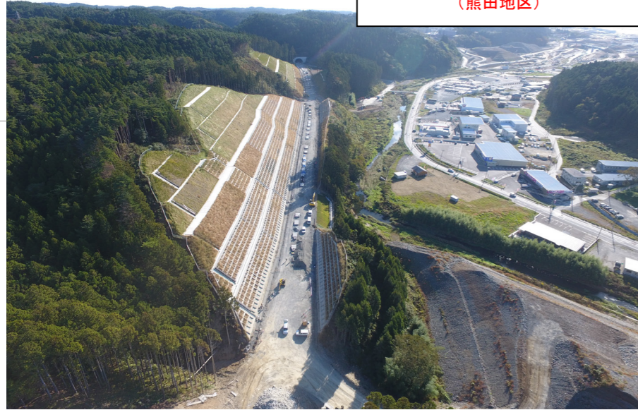
① No.18付近から終点側を望む (熊田地区)