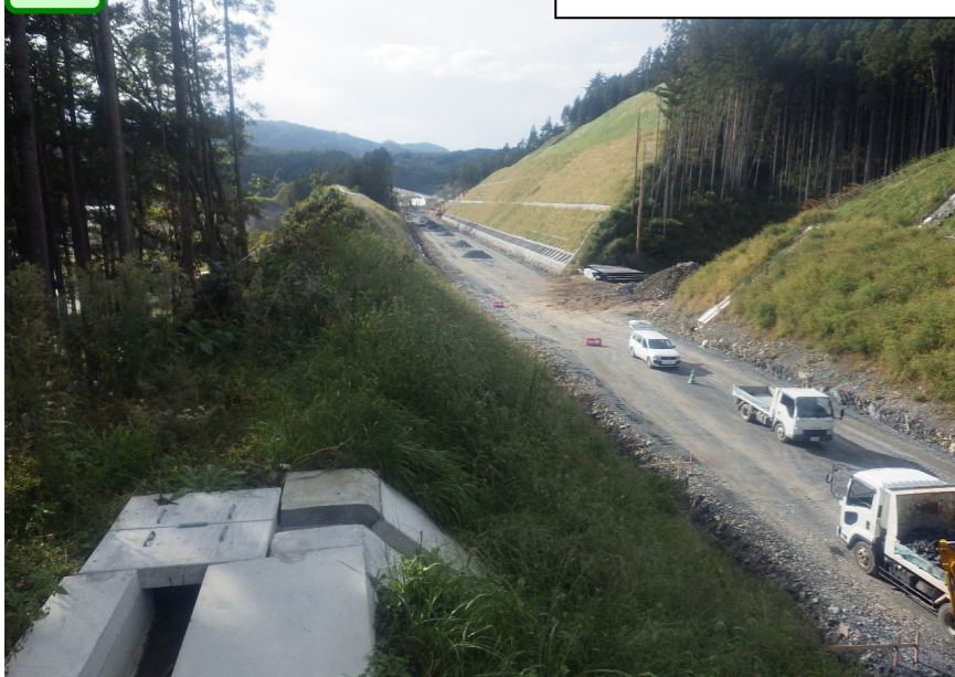
② 2号函渠付近から起点側を望む