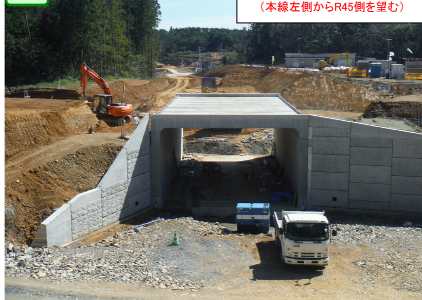
③ No.144付近 (本線左側からR45側を望む)