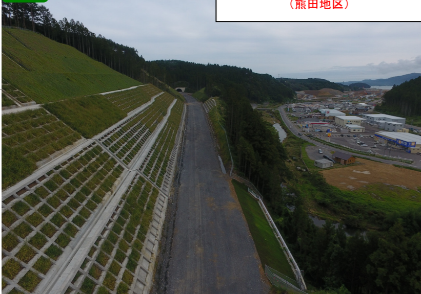
① No.18付近から終点側を望む (熊田地区)