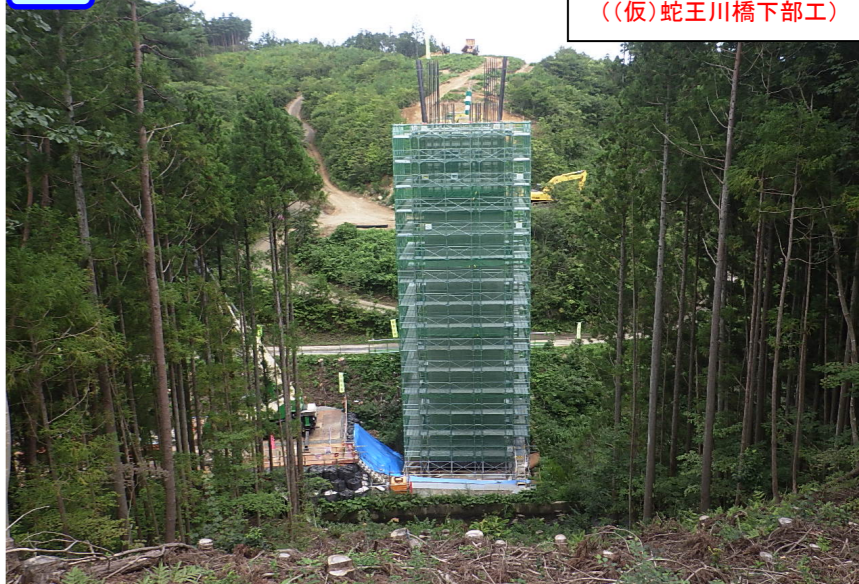
④ 起点側から終点側を望む ((仮)蛇王川橋下部工)