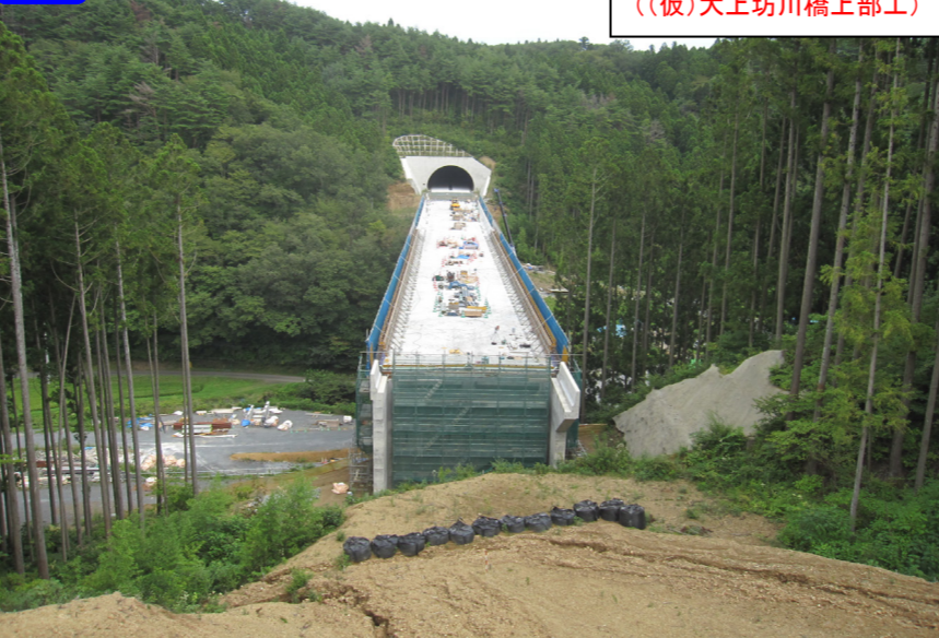
② A1側からA2側を望む ((仮)大上坊川橋上部工)