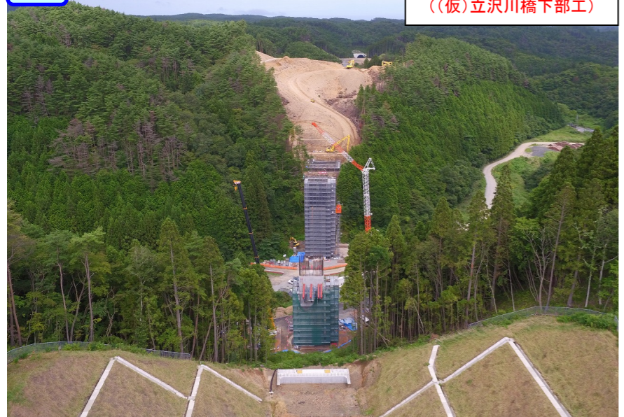
① A1側からP2側を望む ((仮)立沢川橋下部工)