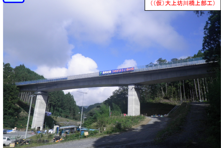
③ 右側からP1、P2を望む ((仮)大上坊川橋上部工)