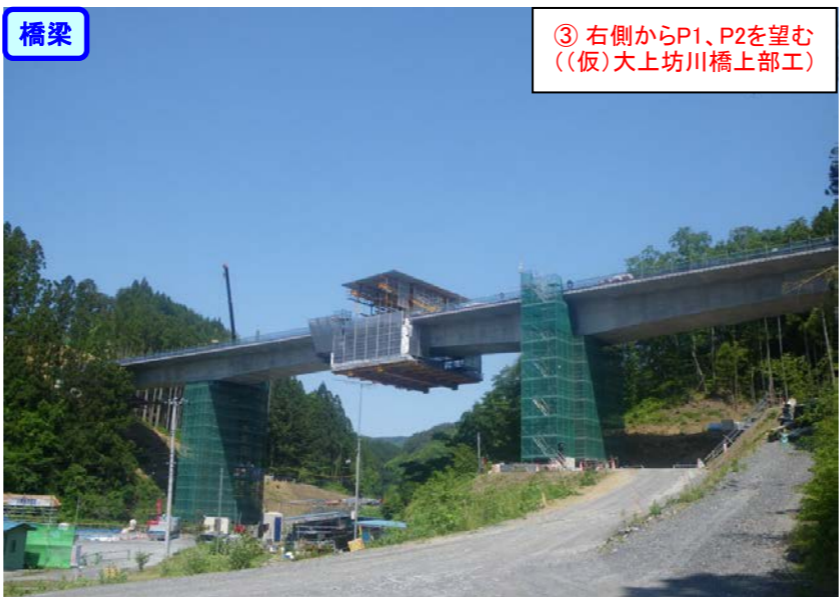
③ 右側からP1、P2を望む ((仮)大上坊川橋上部工)