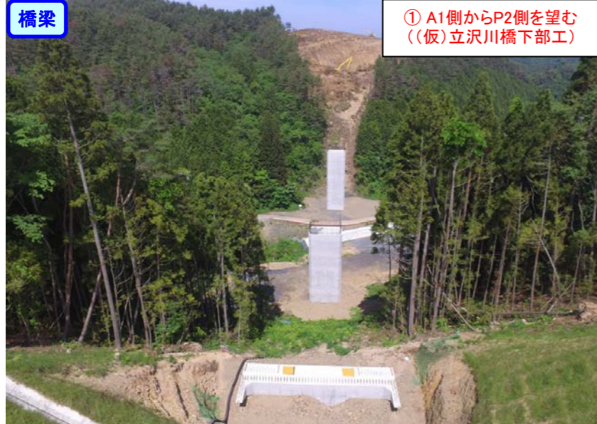
① A1側からP2側を望む ((仮)立沢川橋下部工)