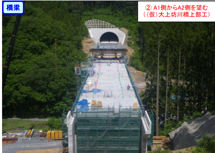
② A1側からA2側を望む ((仮)大上坊川橋上部工)