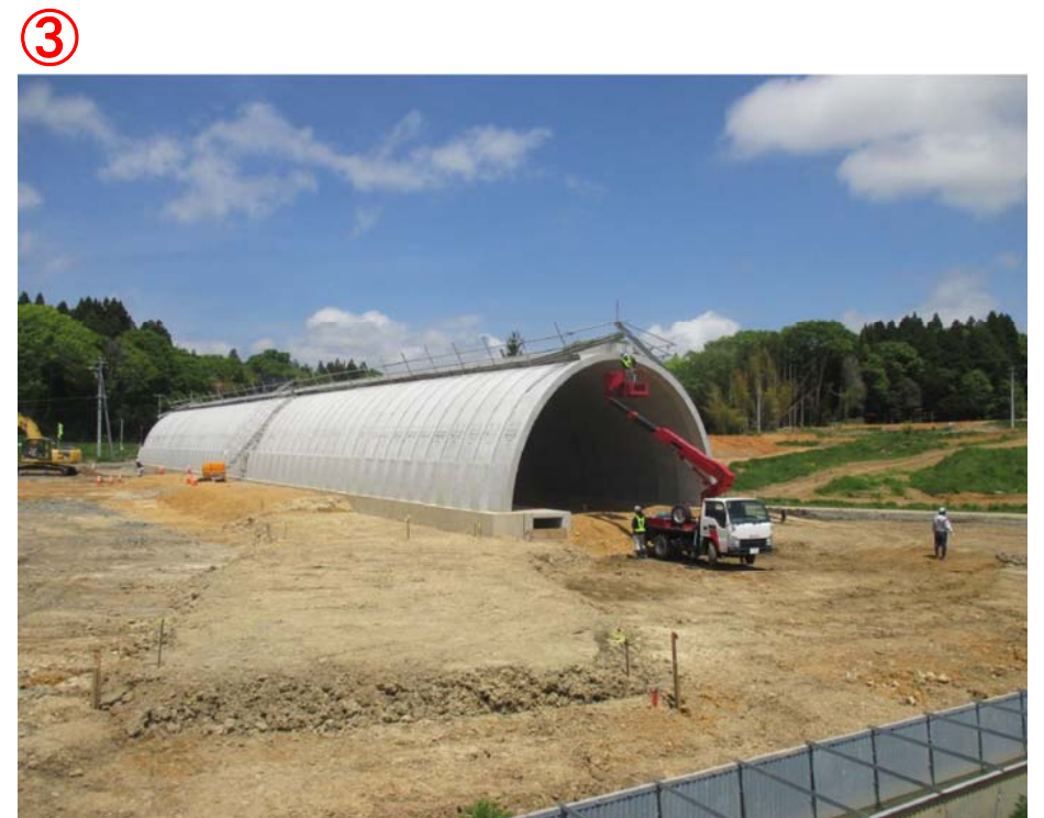
▲No.450南側から本線側を望む