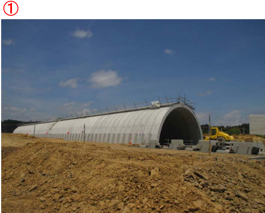
▲No.422南側から本線側側を望む

津谷川橋下部工工事 受注者：前田建設工業(株) 工期：H26.3.14～H29.12