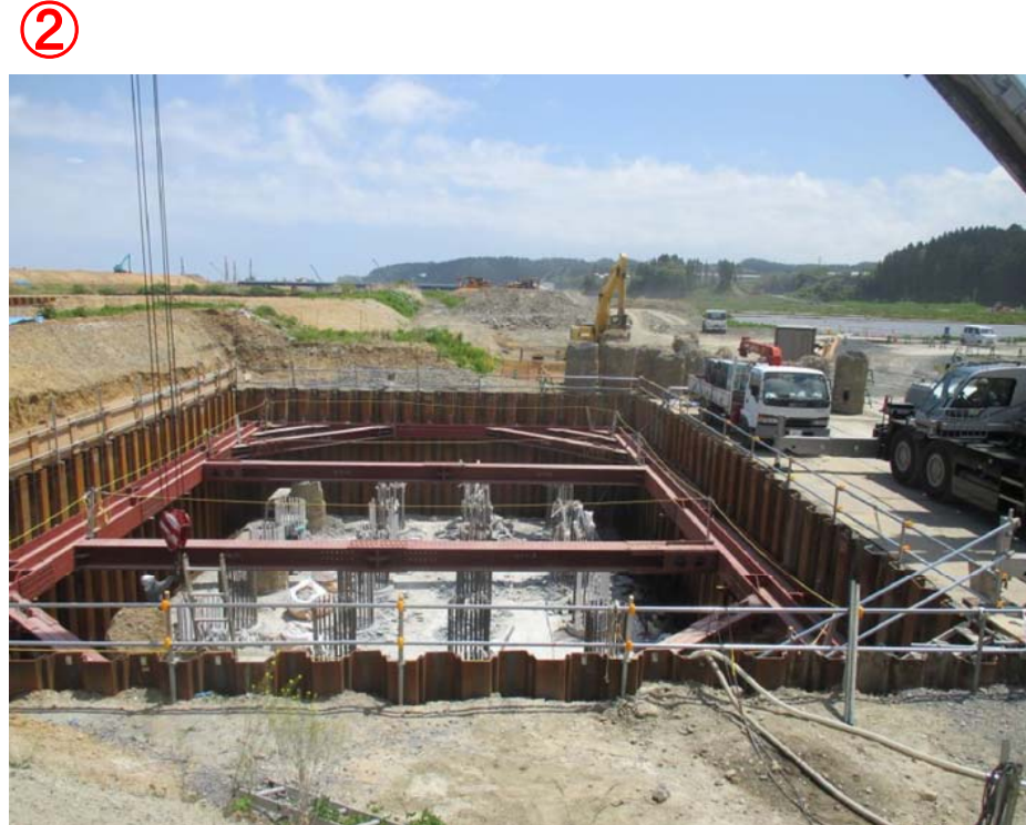
▲No.433から終点側を望む