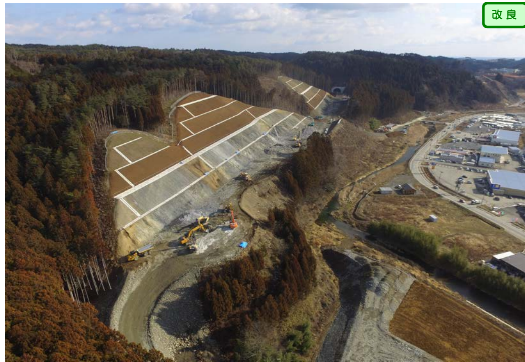
③ No.146付近から起点側を望む