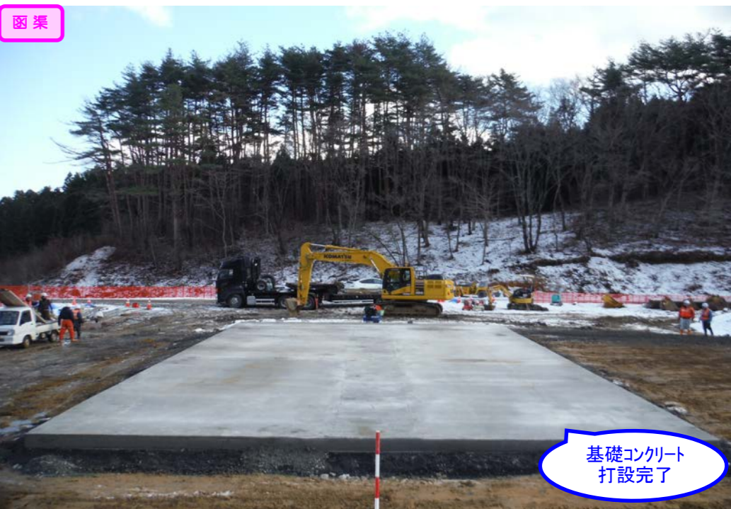
基礎コンクリート打設完了