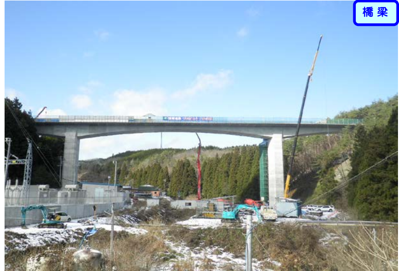
⑤ No.160から終点側を望む