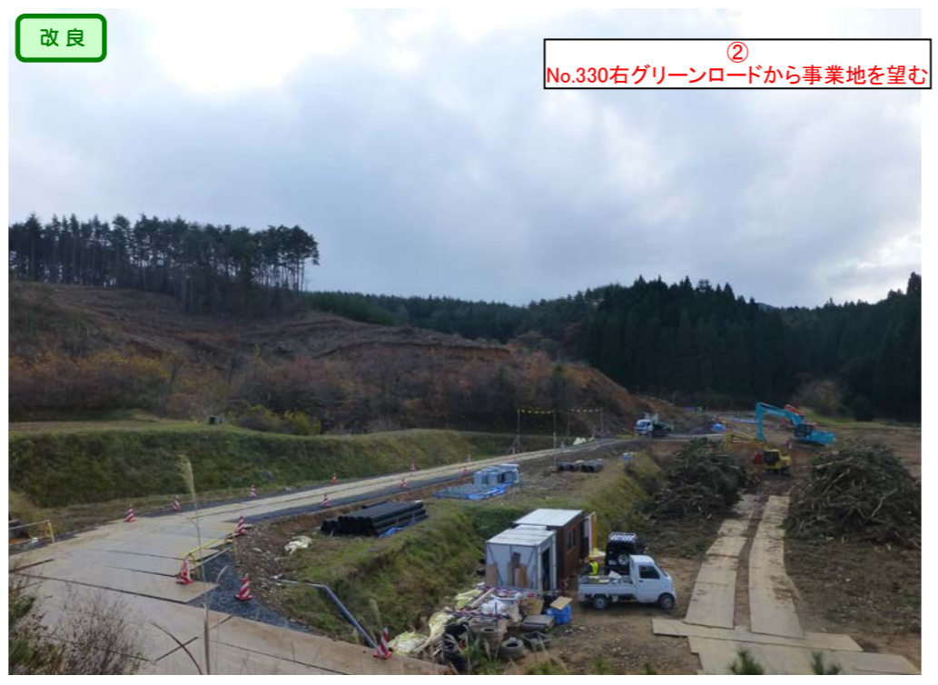
改良 ② No.330右グリーンロードから事業地を望む