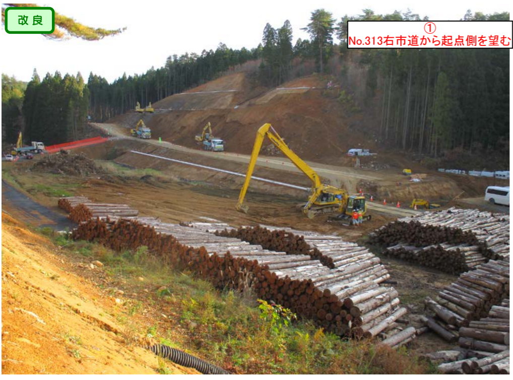
改良 ① No.313右市道から起点側を望む