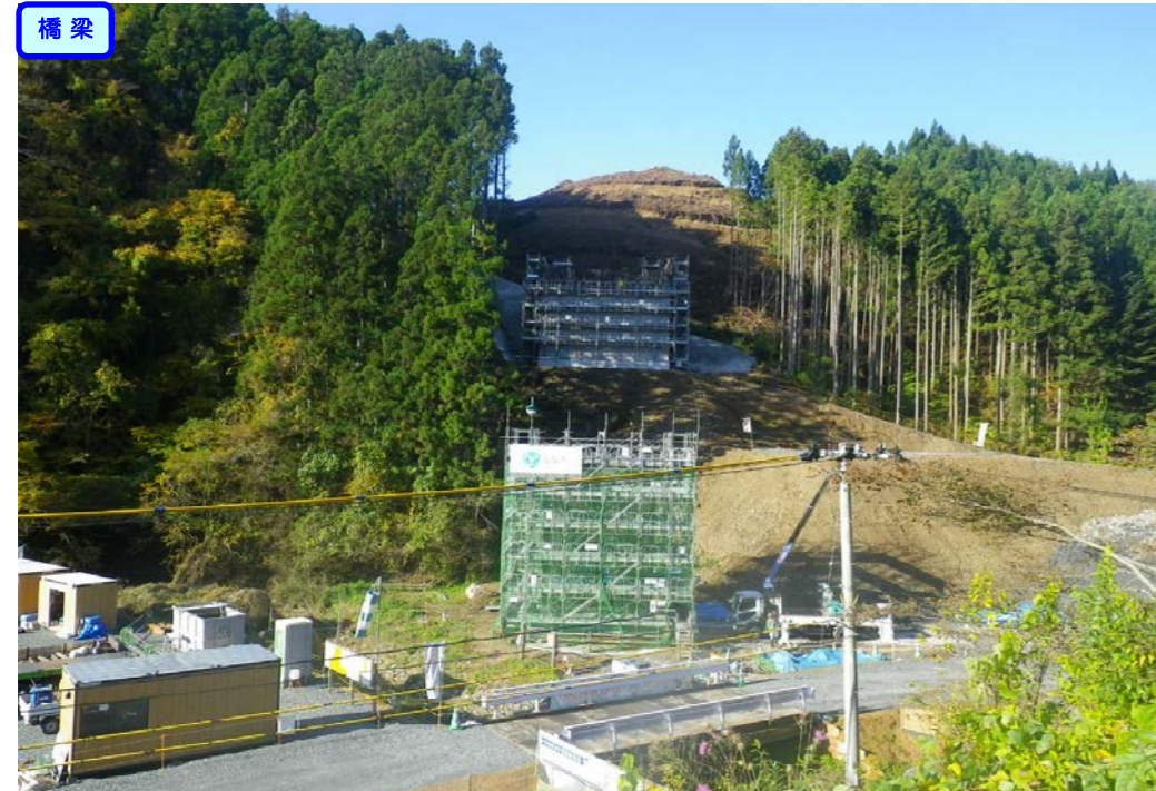
③ 終点側から起点側を望む