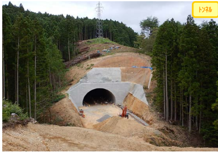
トンネル ① 1号トンネル(終点側坑口)