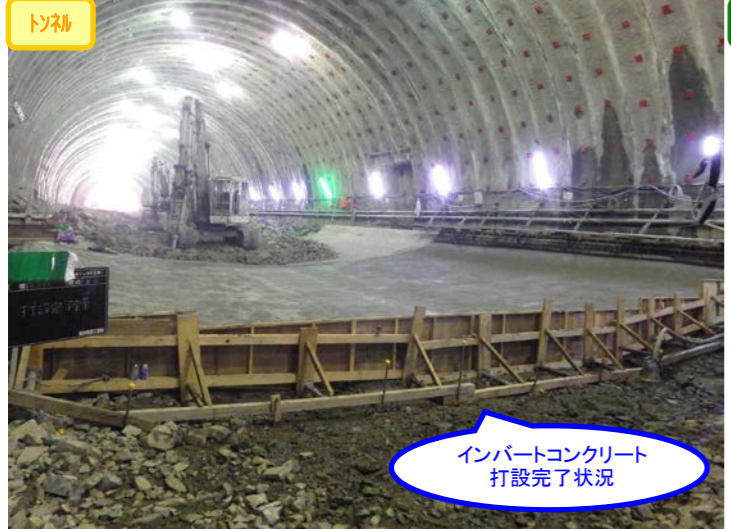
インパットコンクリート 打設完了状況