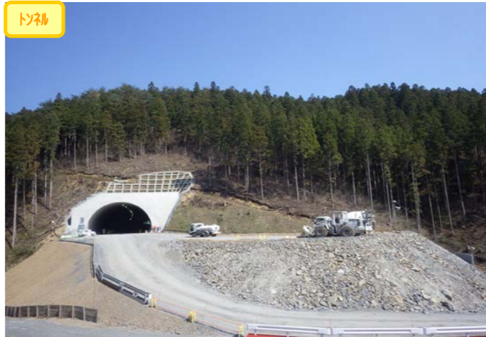
① 1号トンネル 起点側坑口全景