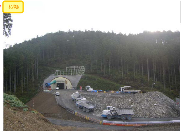
① 南三陸道路1号トンネル 起点側坑口