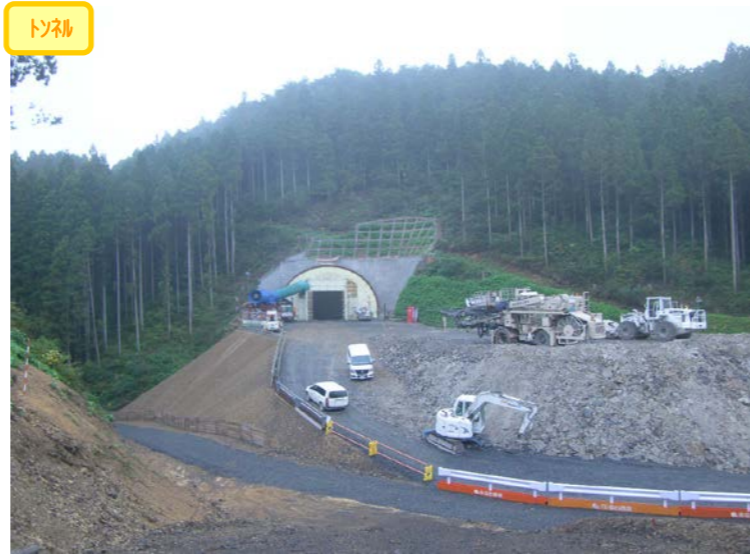
① 南三陸道路1号トンネル 起点側坑口