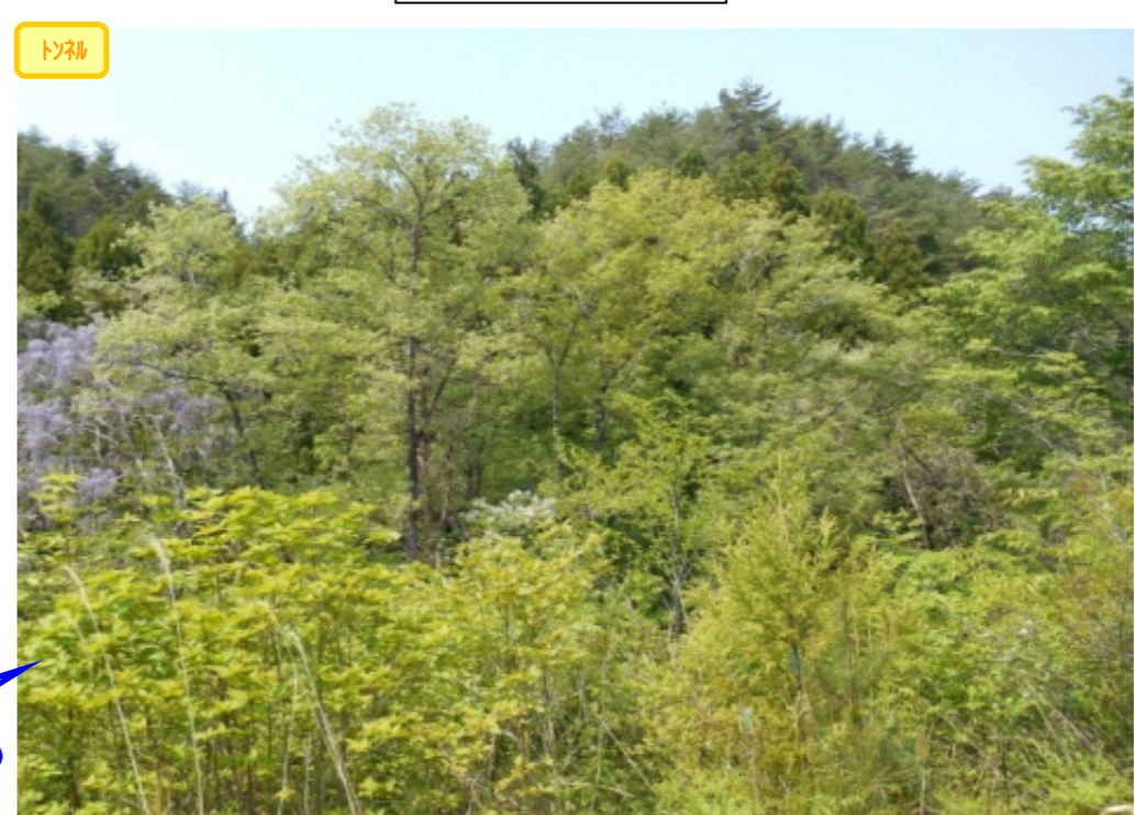
施工前の現況です。