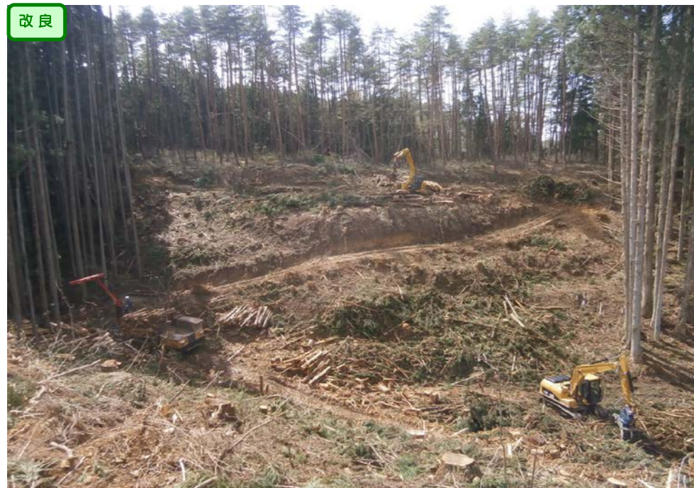
③ No.120から終点側を望む