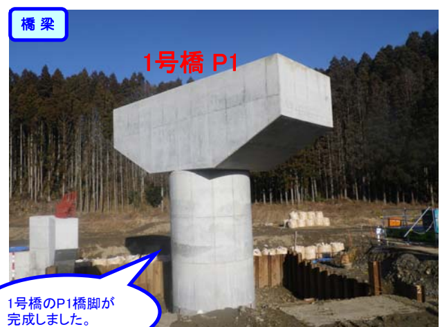
1号橋のP1橋脚が完成しました。