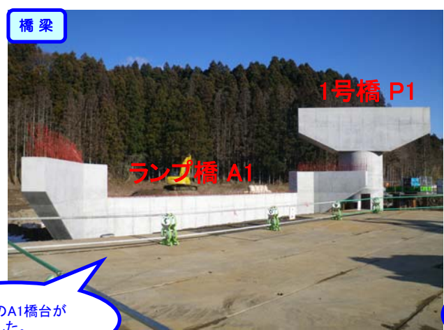
ランプ橋のA1橋台が完成しました。