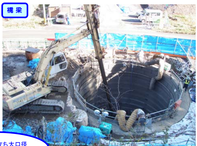
橋脚施工に先立ち大口径深礎杭を施工中です。