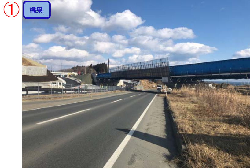
▲No.-1-10西側から終点側を望む