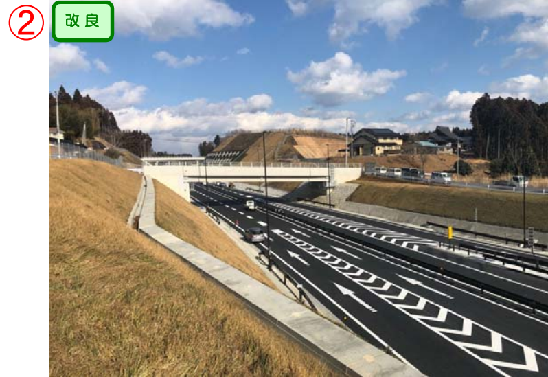
▲No.110南側から終点側を望む