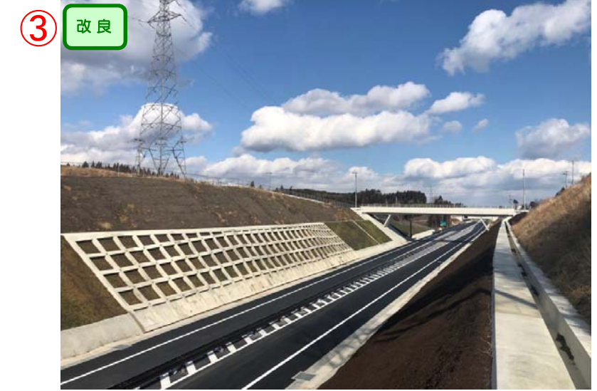
▲No.150南側から終点側を望む