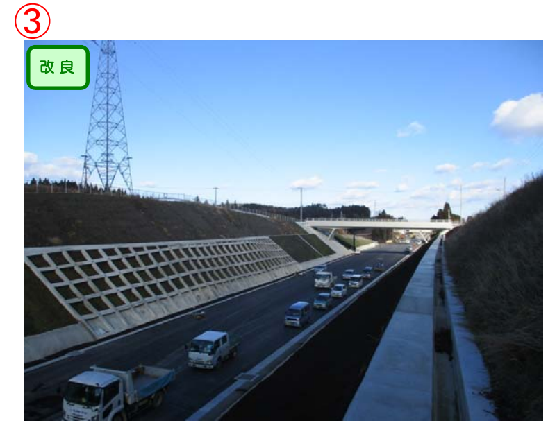
▲No.150南側から終点側を望む