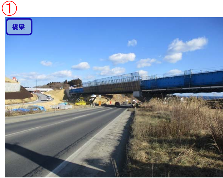
▲No.-1-10西側から終点側を望む