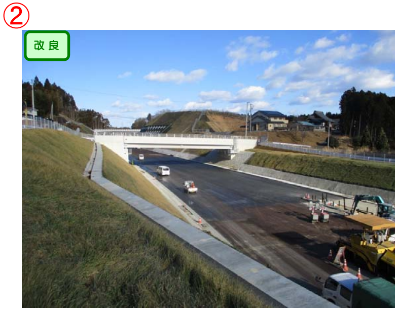
▲No.110南側から終点側を望む