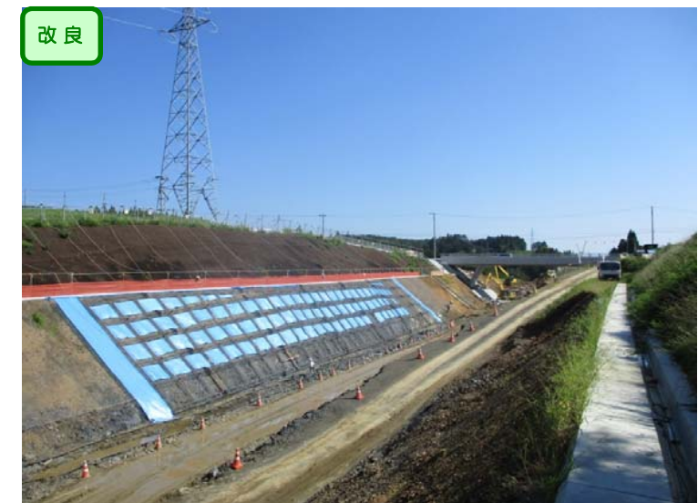
▲No.-1-10西側から終点側を望む