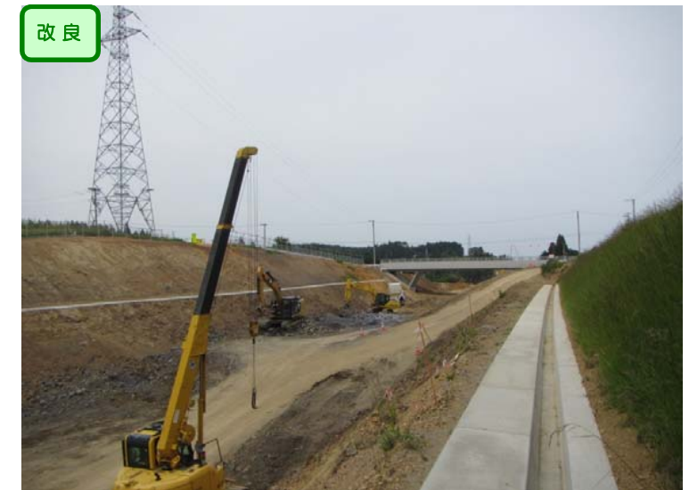
▲No.-1-10西側から終点側を望む