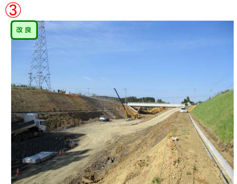
▲No.-1-10西側から終点側を望む