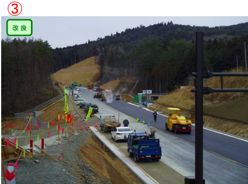
▲No.442より起点側を望む