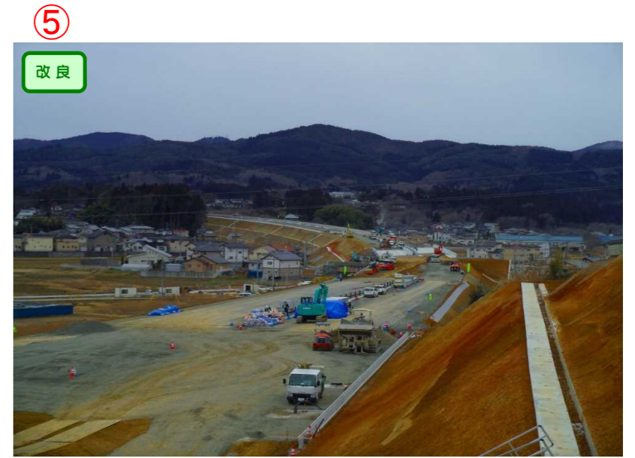
▲No.542より起点側を望む