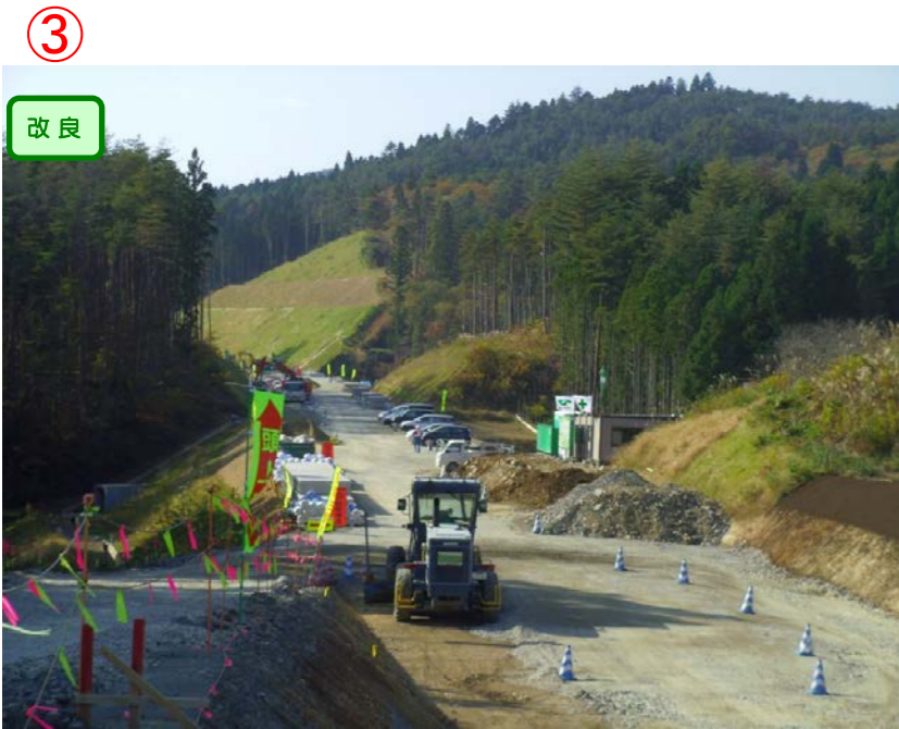
▲No.442より起点側を望む