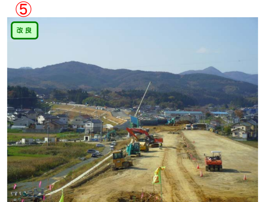
▲No.542より起点側を望む