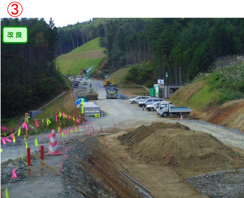
▲No.442より起点側を望む