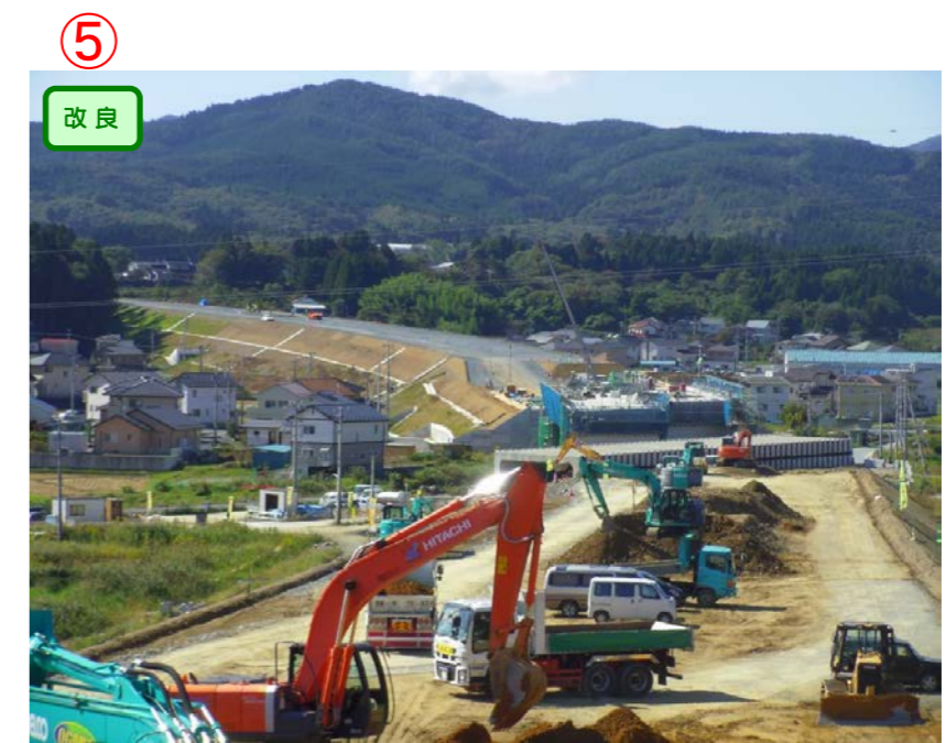
▲No.542より起点側を望む