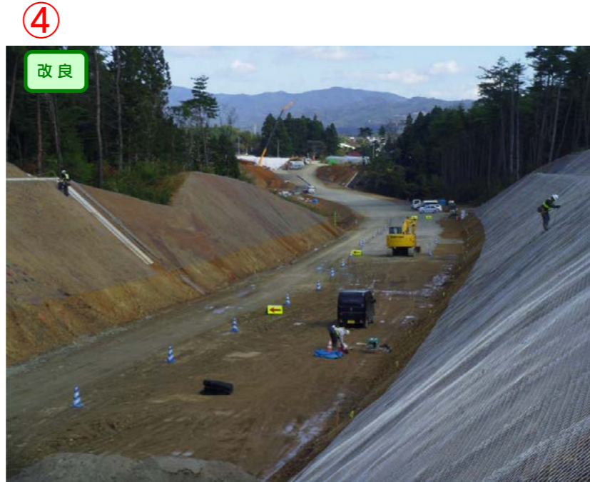
▲No.443より終点側を望む