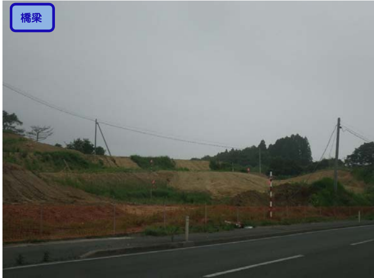
▲No.-1-10西側から終点側を望む