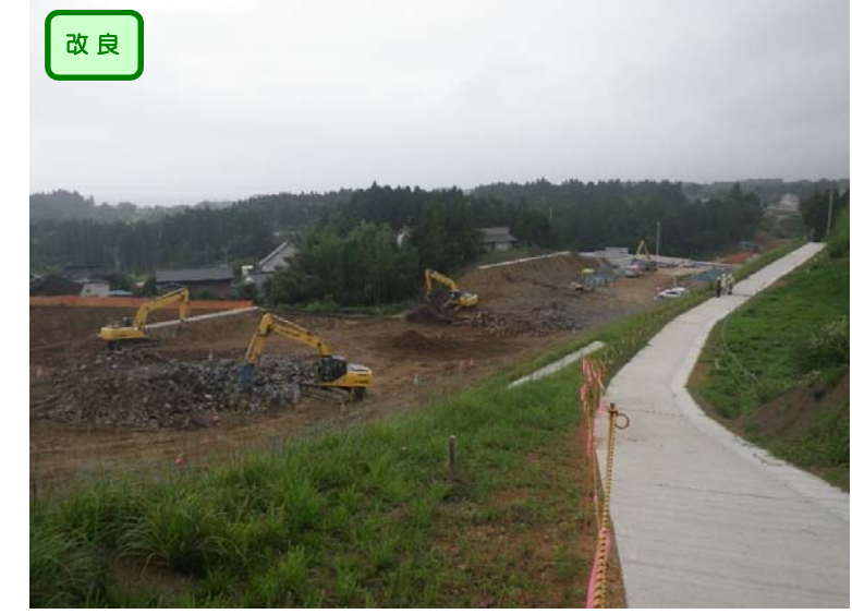
▲No.179西側から起点側を望む