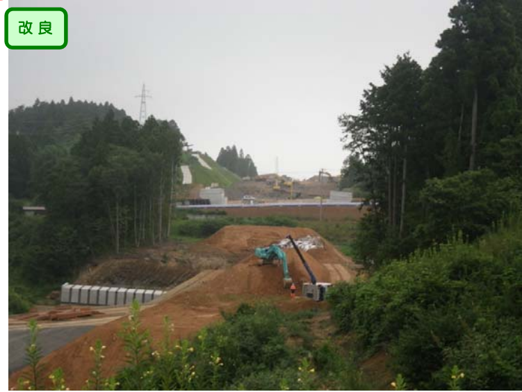
▲No.153東側から終点側を望む