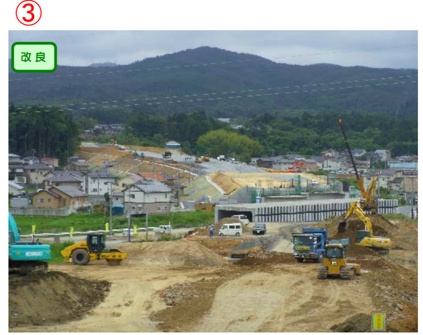
▲No.542より起点側を望む