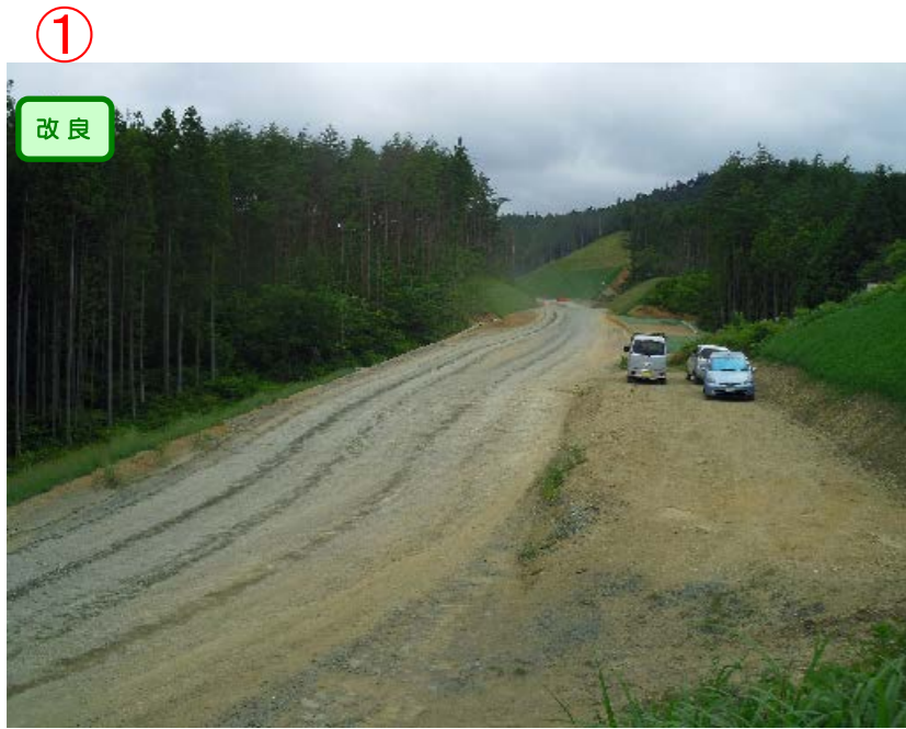
▲No.415より起点側を望む