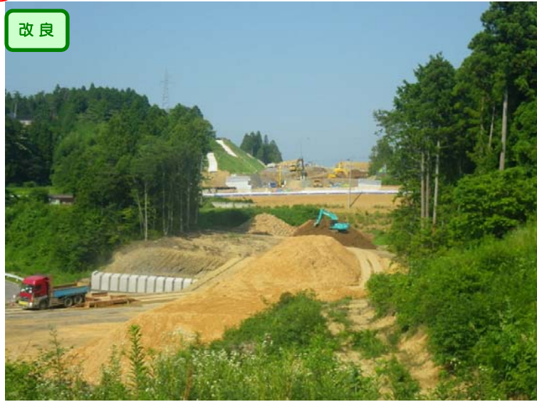
▲No.153東側から終点側を望む