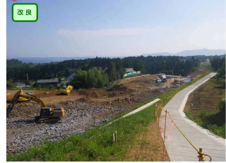
▲No.179西側から起点側を望む