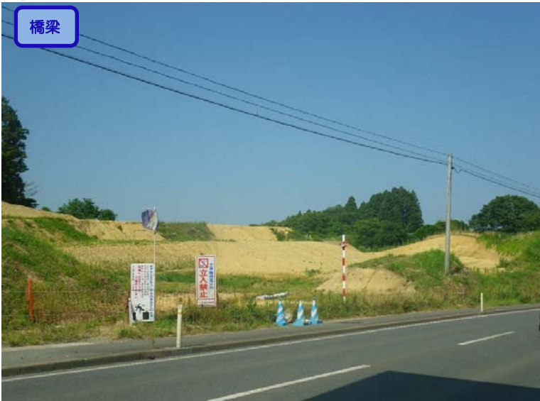
▲No.-1-10西側から終点側を望む