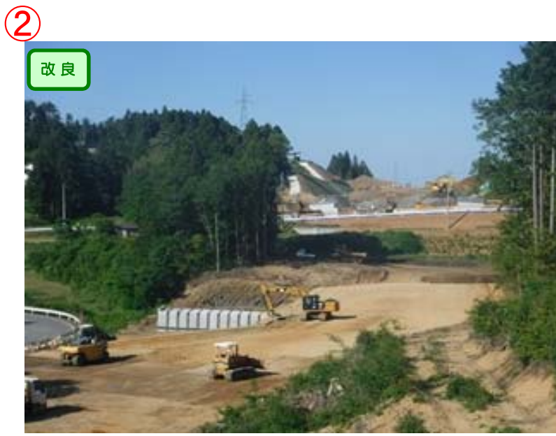
▲No.153東側から終点側を望む