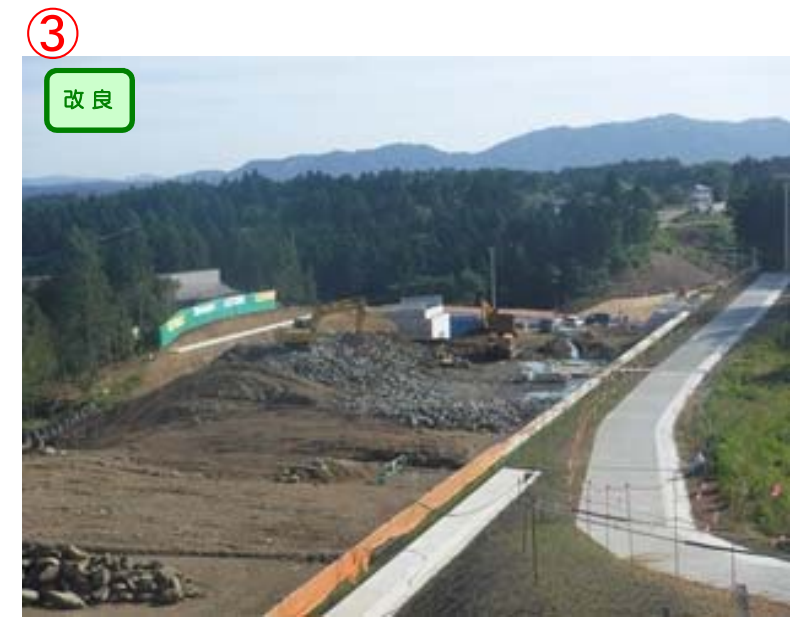
▲No.179西側から起点側を望む