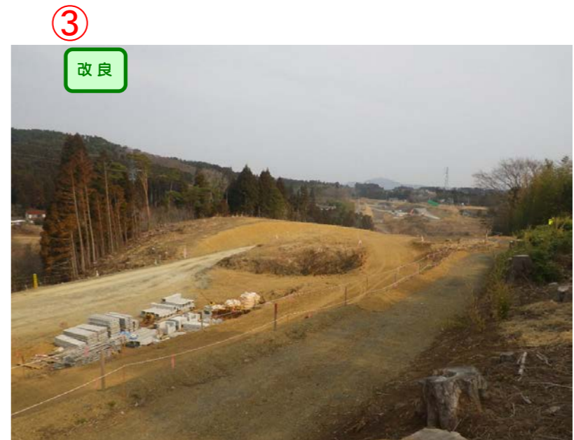
▲No.-1-10西側から終点側を望む