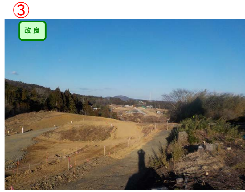
▲No.-1-10から本吉跨道橋A2側を望む