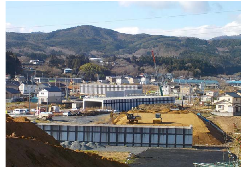
▲No.542より起点側を望む