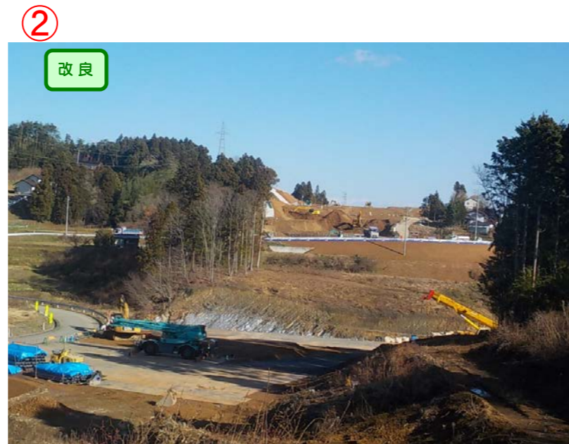
▲No.153から終点側を望む