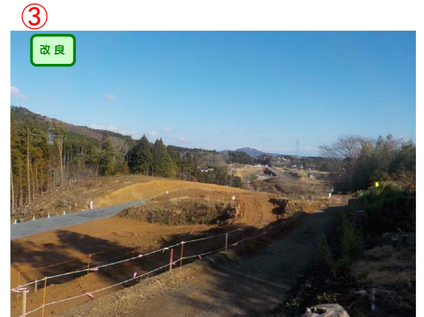
▲No.182から終点側を望む