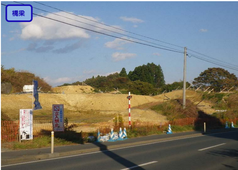
▲No.-1-10から本吉跨道橋A2側を望む