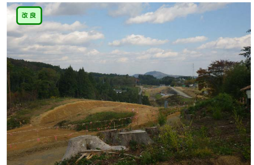
▲No.182から終点側を望む