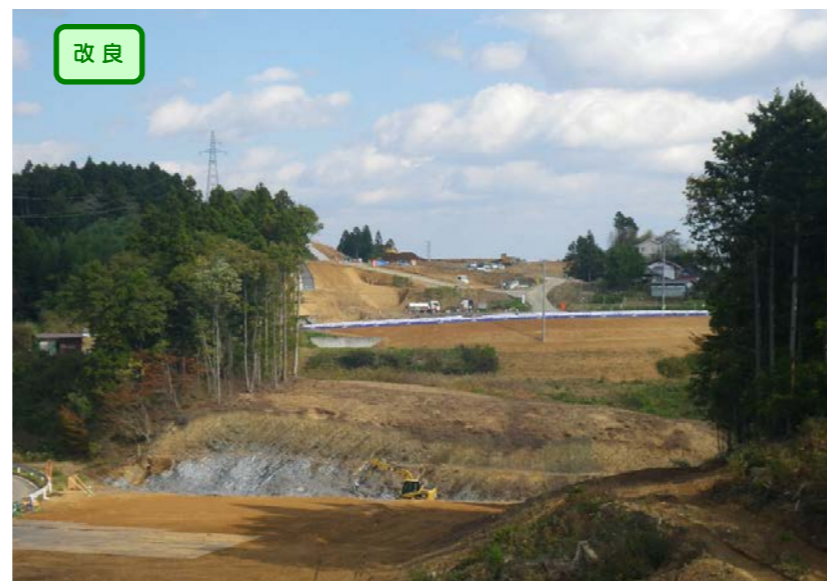
▲No.153から終点側を望む