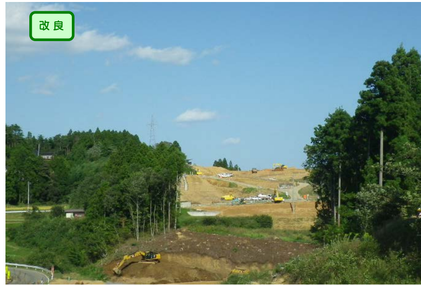
▲No.153から終点側を望む