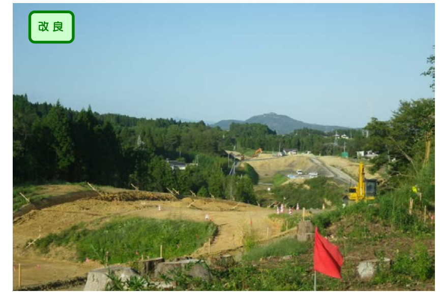
▲No.182から終点側を望む