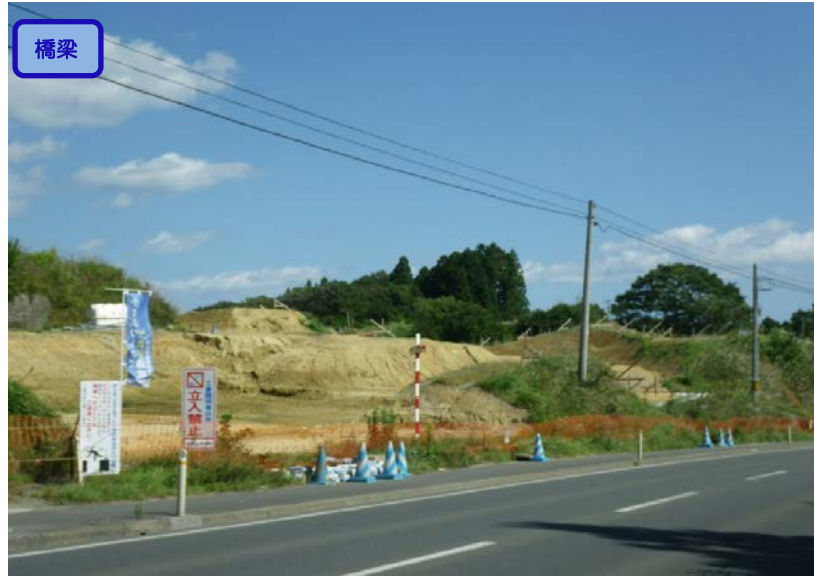
▲No.-1-10から本吉跨道橋A2側を望む