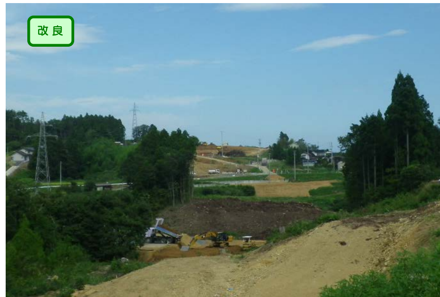
▲No.153から終点側を望む