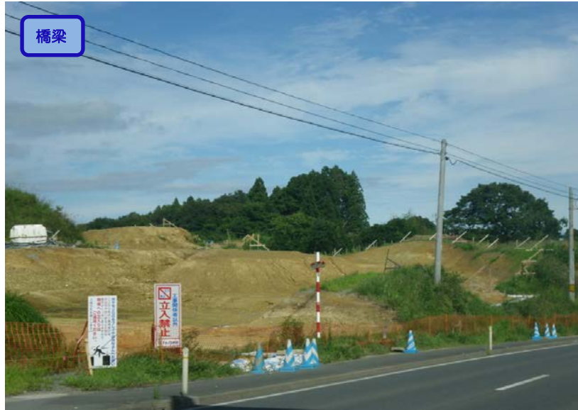
▲No.-1-10から本吉跨道橋A2側を望む