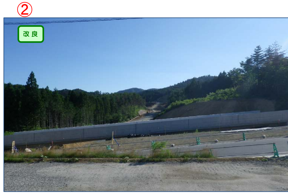
▲No.444より起点側を望む