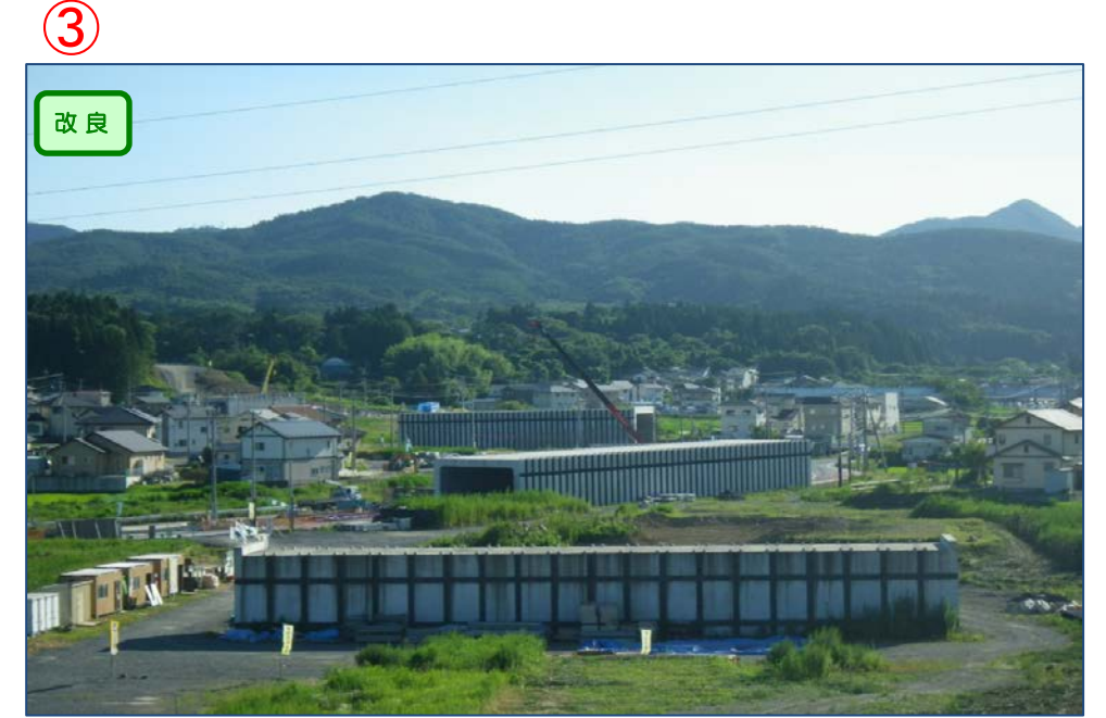
▲No.542より起点側を望む

面瀬地区道路改良工事 受注者：(株)新庄・鈴木・柴田組 工期：H28.4.1～H29.6.16