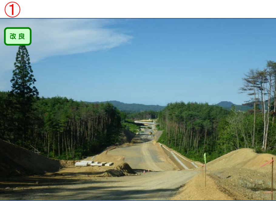
▲No.415より終点側を望む